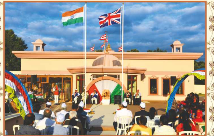
અનુપમ મિશન, ડેન્હમ-યુ.કે. મંદિરના પ્રાંગણમાં ભારતના સ્વાતંત્ર્યપર્વે રાષ્ટ્રવંદના